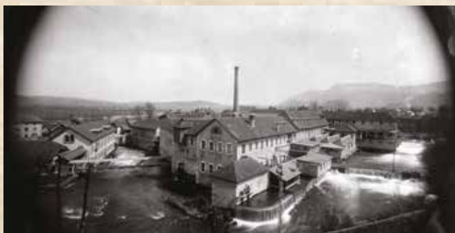
Les papeteries de Cran

Les papeteries Aussedat innovent également sur le plan social (mutuelle, service médico-social). Elles restent dans les mains de la famille Aussedat par le biais d'alliances familiales jusqu'en 1975. Ensuite, différents groupes étrangers à la famille dirigent l'usine jusqu'à sa liquidation en 2006. Une collecte de sauvetage en urgence de près de 200 mètres linéaires d'archives est alors réalisée par les Archives départementales de la Haute-Savoie, préservant ainsi la mémoire d'une entreprise qui a marqué le paysage industriel de Cran pendant près de deux siècles.