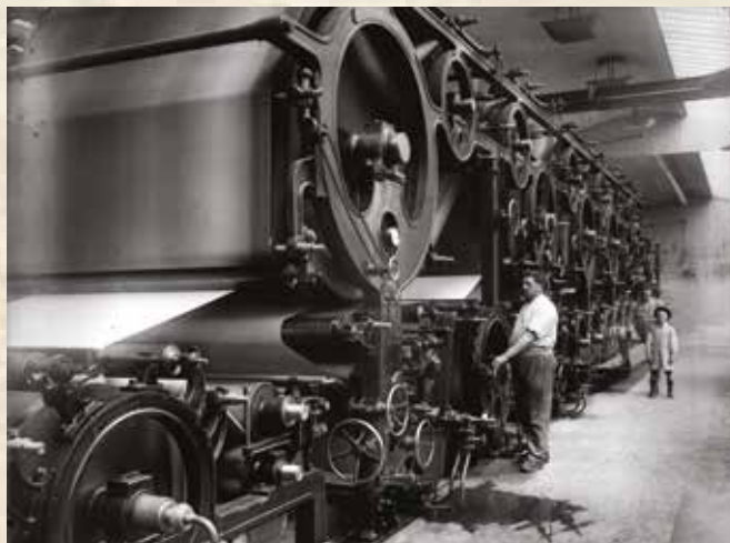
Papeteries de Cran. Machine à papier n° 3.