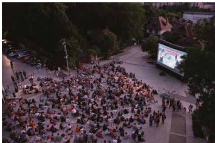
Projection en plein air, Le sommet des dieux , 2022

Le Département prolonge la fête du cinéma d'animation sur l'ensemble de son territoire afin que tous les Haut-Savooyards, de tous âges, puissent en profiter près de chez eux. Du 25 juin au 9 juillet 2023, c'est la tournée départementale. Des films issus de la sélection officielle du festival 2023 circulent en Haute-Savoie dans les cinémas partenaires du réseau Art et Essai.