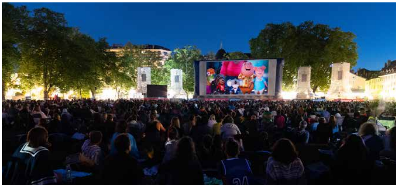
Projection en plein air, Tous en scène 2 , 2022

PROGRAMMATION À RETROUVER SUR ANNECYFESTIVAL.COM